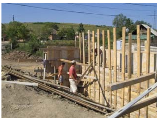
Reabilitare drum si pod, cartier Pusta Vale, oras Simleul Silvaniei