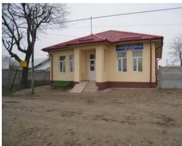
Reabilitare cladire si infiintare centru social multifunctional, sat Listeava, comuna Ostroveni.