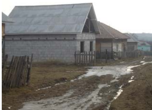
Drumul de reabilitat din satul Budacu de Sus