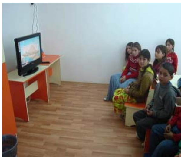
Activitati cu copiii in centrul de zi construit, sat Balteni, comuna Contesti