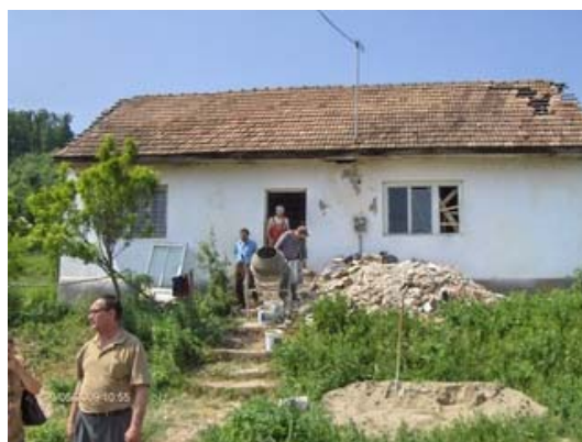
Reabilitarea unei cladiri si infiintarea, in cadrul acesteia, unui centru social multifunctional, Jibou