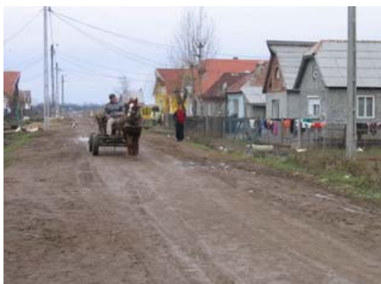
Drumul de reabilitat, sat Cidreag