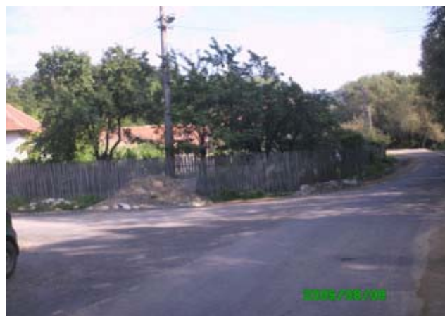
Drum reabilitat in satul Polovragi