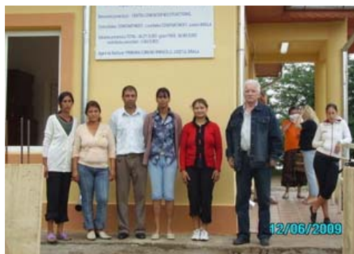
Centrul multifunctional realizat, sat Constantinesti