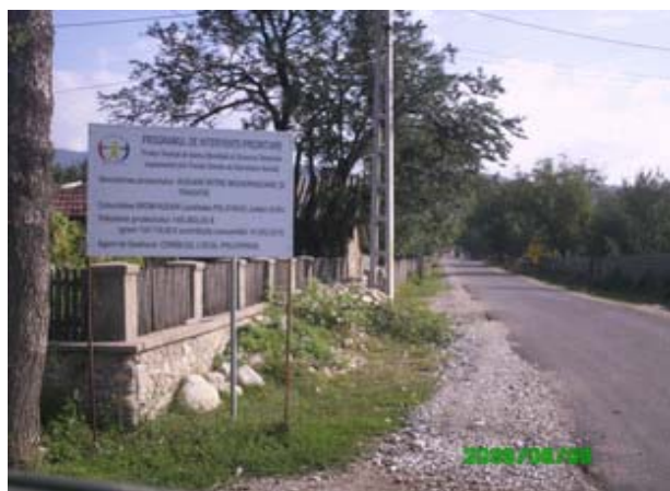
Reabilitarea drumului de acces, satul Polovragi