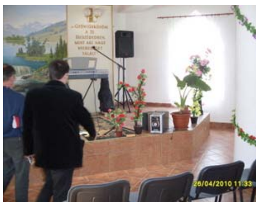
Activitati de educatie muzicala, comunitatea Danko Pista, oras Sacuieni