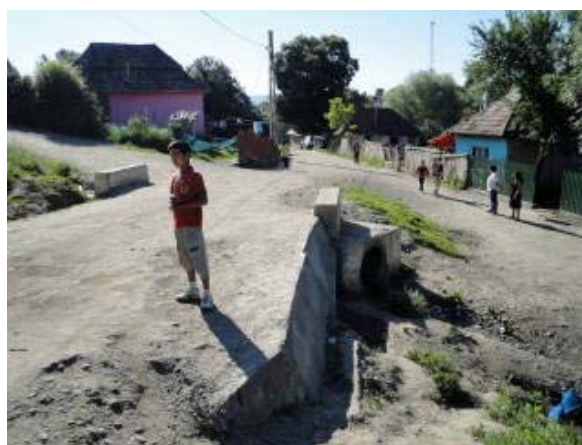
Reabilitarea drumului de acces in comunitatea de romi din satul Glodeni