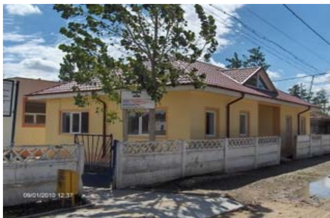
Centru multifunctional, localitatea Traian