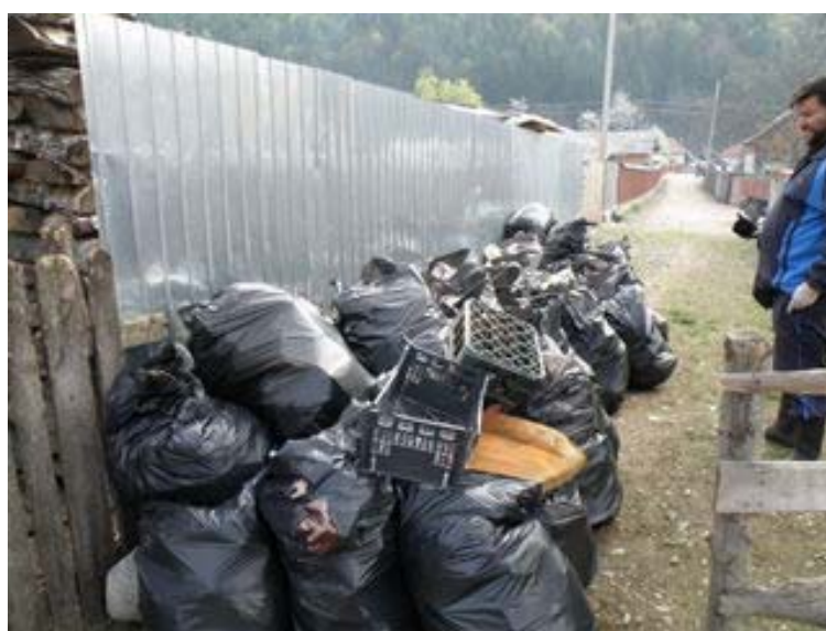
Ecologizarea comunitatii Salistea, Horezu