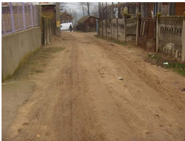
Reabilitarea drumului de acces in comunitatea de romi, comuna Sadova