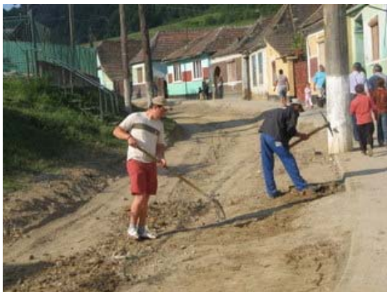
Reabilitarea drumului din comuna Brateiu