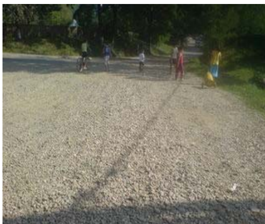
Pietruirea drumului de acces in comunitate, sat Patrauti