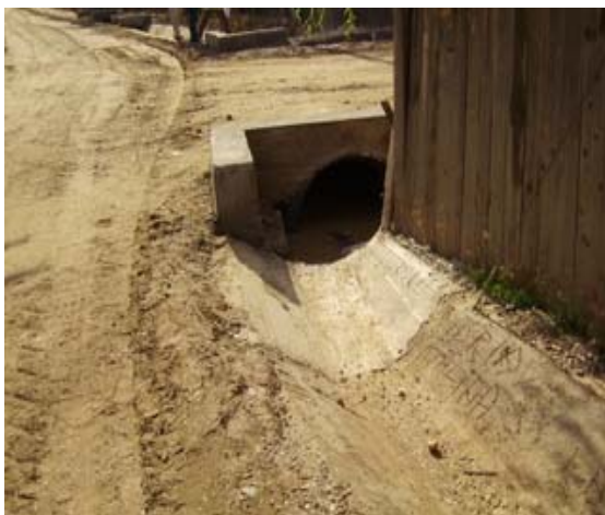
Instalarea de podete pe drumul reabilitat in cartierul Chietris, comuna Homocea