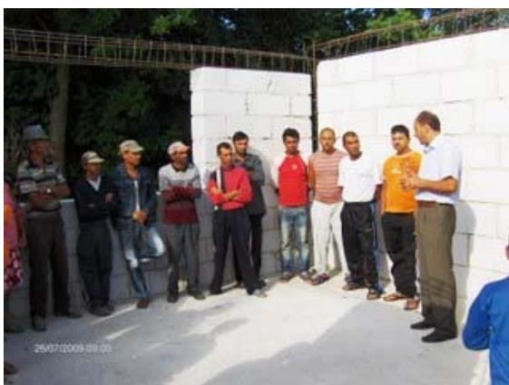
Constructia centrului social multifunctional, Valea Naoiului