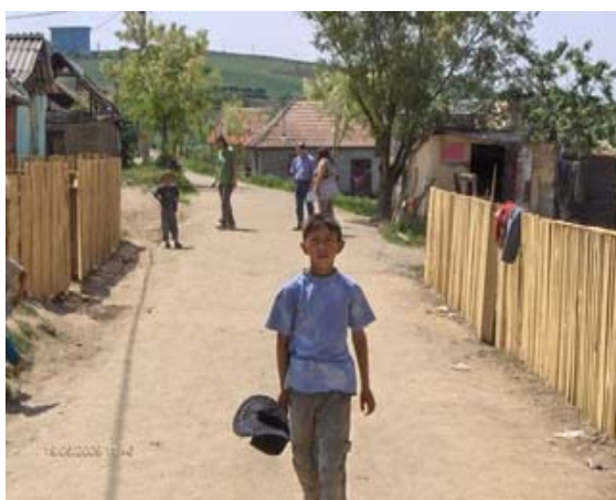
Reabilitare a trei drumuri de acces in comunitate si a sapte podete tubulare, comuna Band