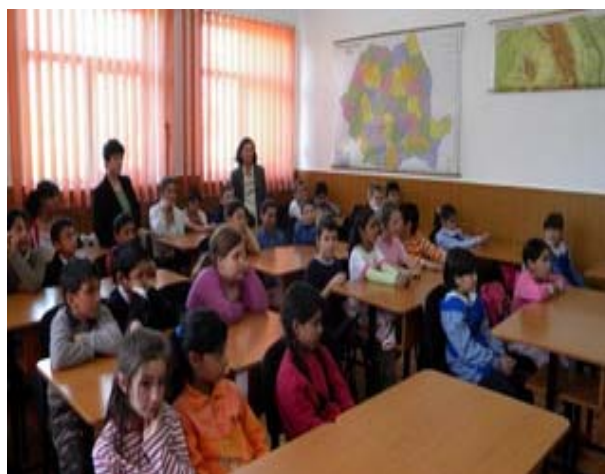
Desfasurarea activitatilor de tip "after school" in centrul multifunctional infiintat, Municipiul Buzau