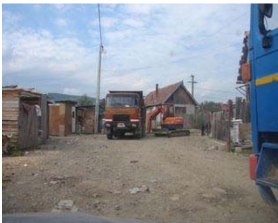
Reabilitarea drumului din nteriorul comunitatii de romi din Gilau