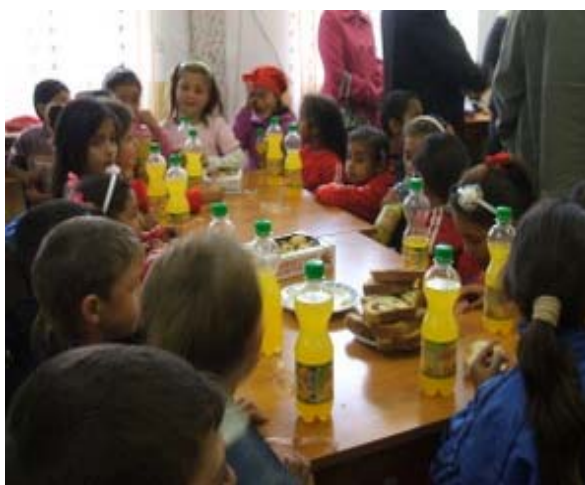
Activitati cu copiii in centrul multifunctional, sat Slobozia, comuna Voinesti