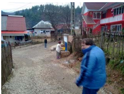
Extinderea retelei de apa potabila in satul Ticau, comuna Ulmeni