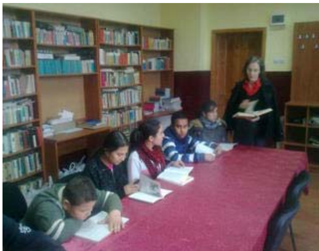
Activitati in clubul de arta si cultura, sat Greoni