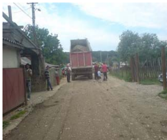
Pietruirea drumului de acces in comunitate, sat Patrauti