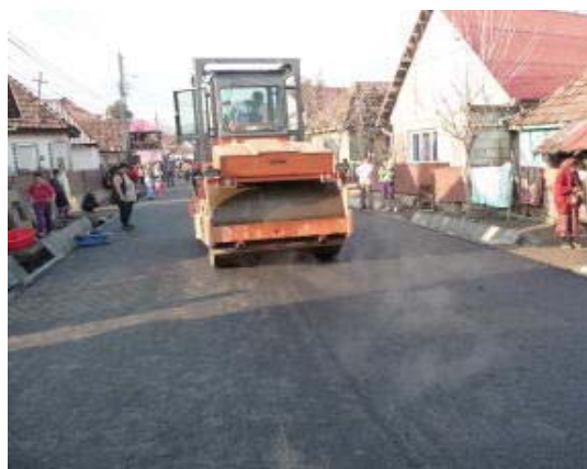
Modernizarea drumului de acces in cartierul Apalina, municipiul Reghin