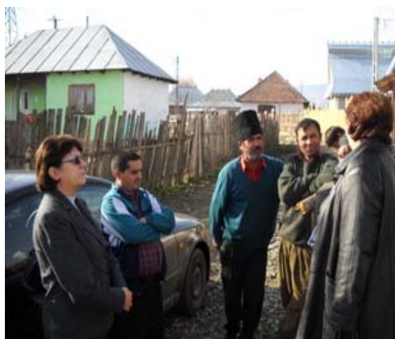
Campanie de promovare a ingrijirii sanatatii si protectia mediului, Darmanesti