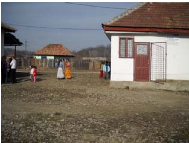
Reabilitare drum, cartier Bratulesti, oras Darmanesti