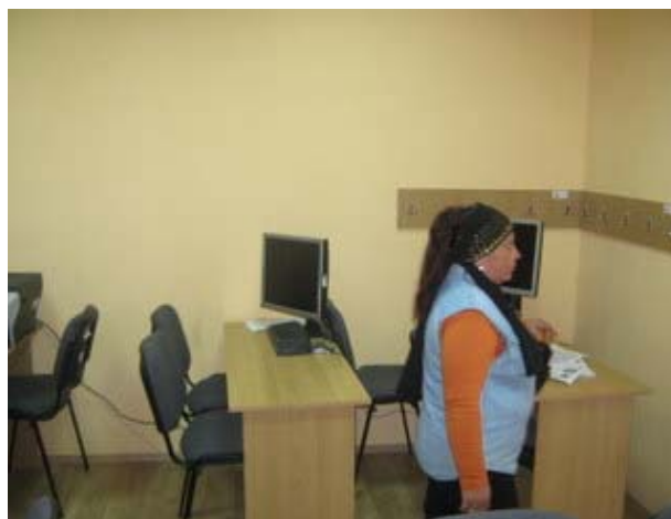
Centru de zi pentru copii, sat Cergau