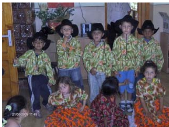
Activitati de dans traditional, oras Somcuta Mare