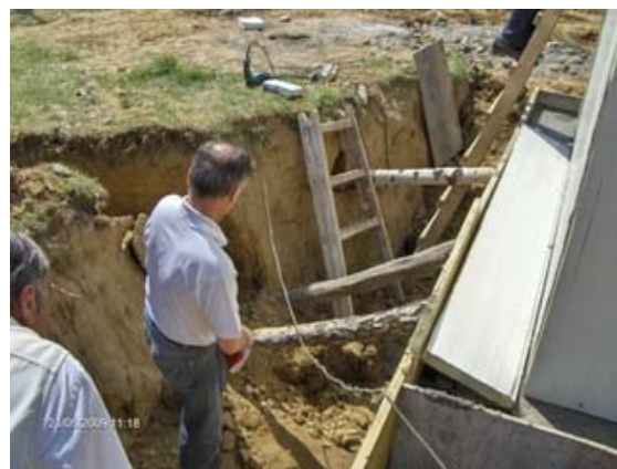
Extinderea retelei de apa potabila in comunitatea de romi, oras Somcuta Mare