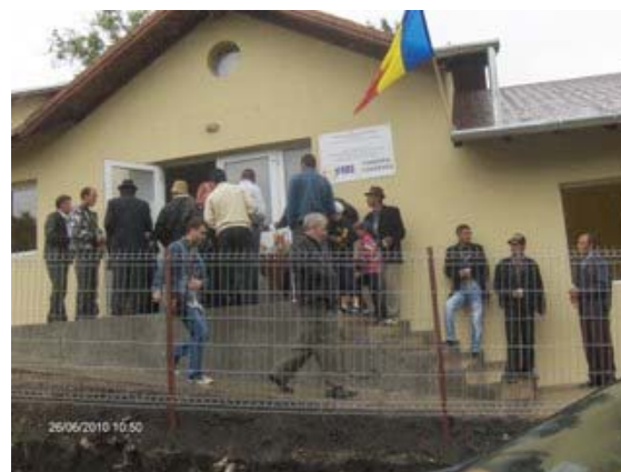
Furnizare de servicii comunitare in cadrul centrului construit, Valea Naoiului