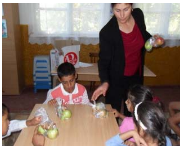
Activitati cu copiii in centrul social multifunctional construit, sat Buciumeni