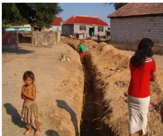
Extinderea retelei de alimentare cu apa, comuna Vadu Crisului