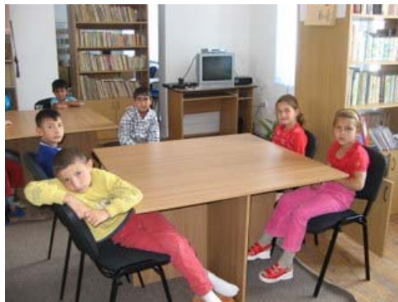
Centru de zi pentru copii, comuna Brateiu