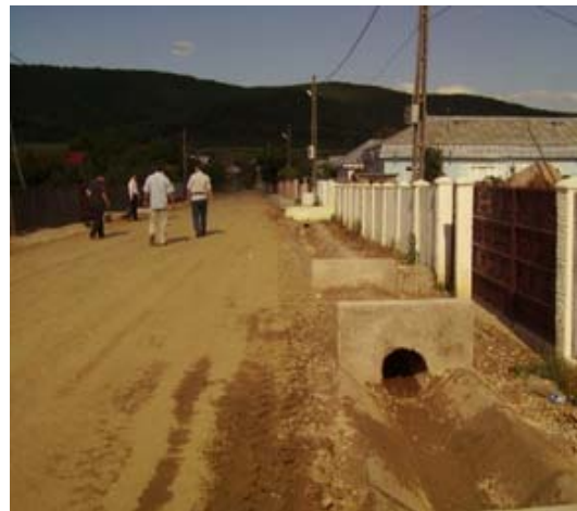
Reabilitarea infrastructurii de acces in cartierul Chietris, comuna Homocea