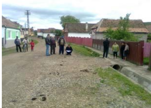
Reabilitarea drumului din interiorul comunitatii, comunitatea Tatarlaua, comuna Cetatea de Balta