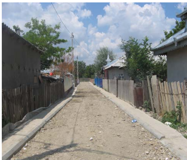
Drum reabilitat in cartierul FNC Livada, Municipiul Calarasi