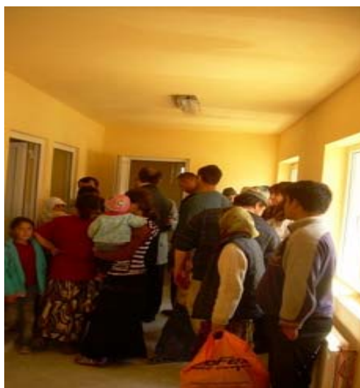
Baie publica si spalatorie, sat Cerat, comuna Valcau de Jos