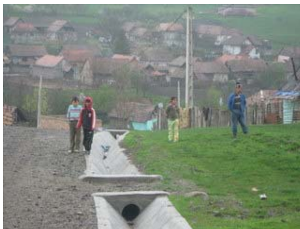
Reabilitarea strazii Morii, sat Cergau