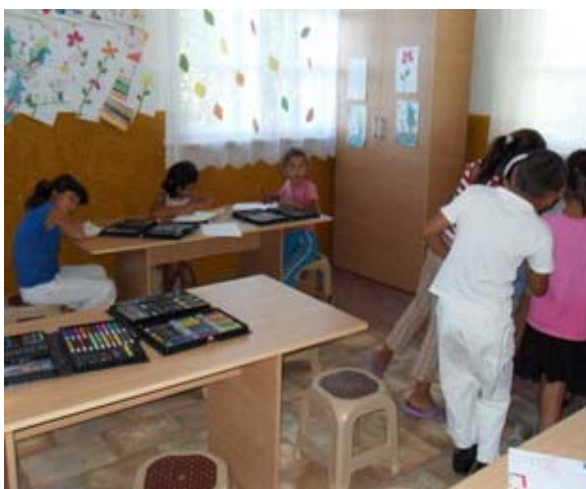
Activitati cu copiii in centrul social multifunctional construit, sat Buciumeni