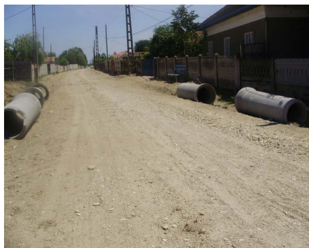
Modernizare drumuri din interiorul comunitatii de romi, sat Listeava, comuna Sadova