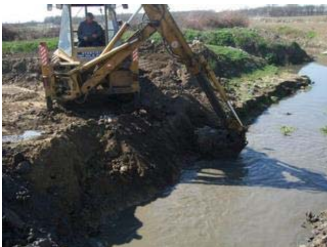
Reabilitarea drumului, comuna Mihail Kogalniceanu