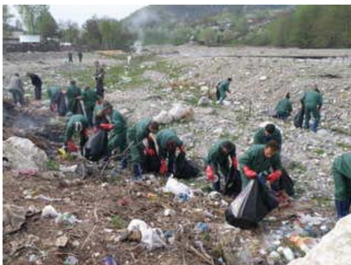
Actiunea membrilor comunitatii de ecologizare a comunitatii, catun Salistea, Horezu