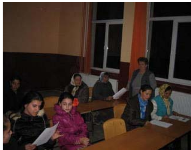
Servicii comunitare de informare si consiliere, sat Greoni