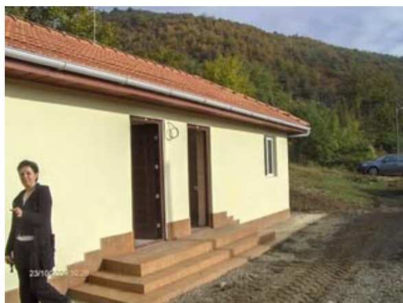
Grupul social construit in comunitatea Steampuri, orasul Brad