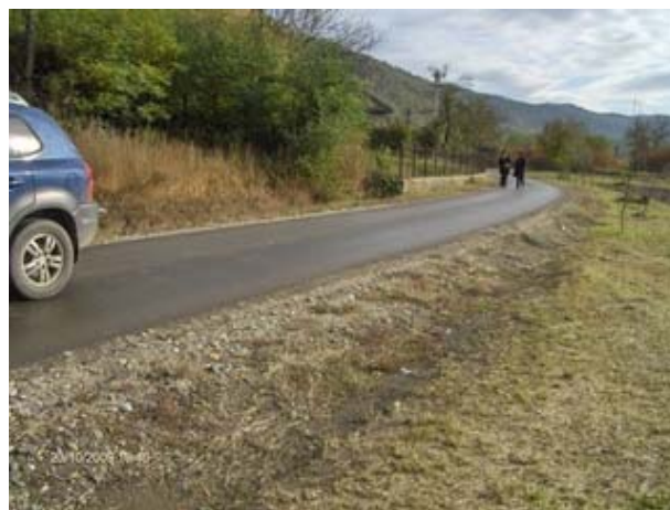
Drumul reabilitat din comunitatea Steampuri, orasul Brad