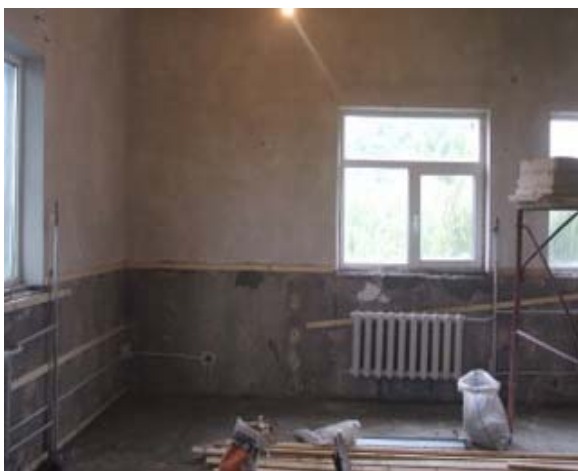
Amenajarea spatiului pentru infiintarea unui centru multifunctional pentru copiii, Municipiul Buzau