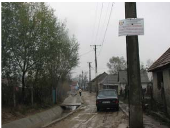
Realizarea canalizarii pluviale, comunitatea Carei