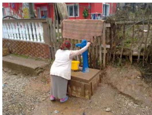
Extinderea retelei de apa potabila in satul Ticau, comuna Ulmeni