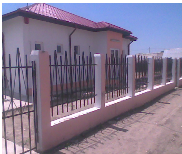
Centru Social Multifunctional, cartier Obor Nou, Municipiul Calarasi