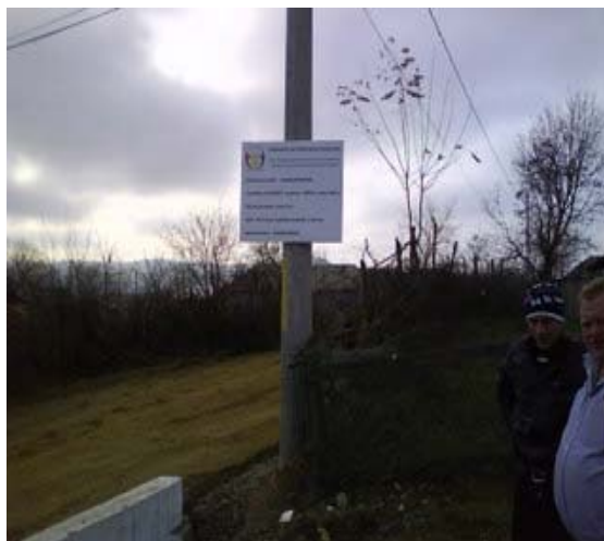
Drumul comunitar reabilitat, sat Bacesti