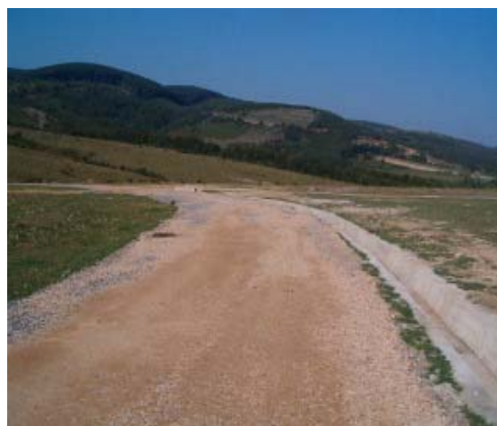
Reabilitarea drumului de acces in comunitate, comuna Vadu Crisului