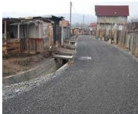
Drumul reabilitat, Gilau