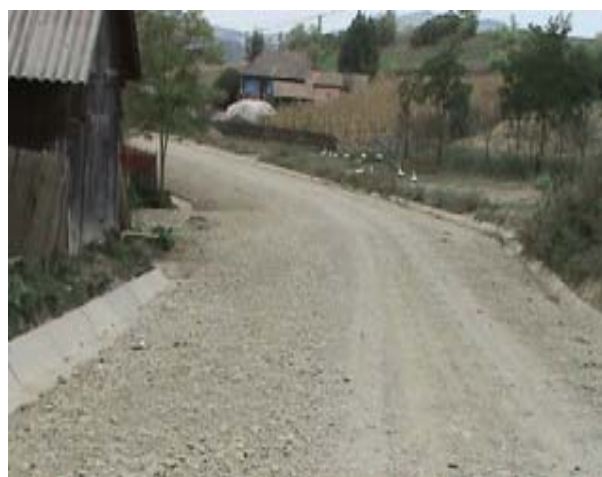
Drumul reabilitat in satul Tagu