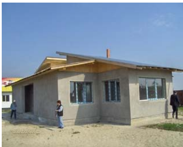
Construirea centrului de zi pentru copiii din satul Balteni, comuna Contesti