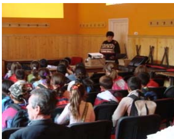
Campanie de promovarea ingrijirii sanatatii, comunitatea Tatarlaua, comuna Cetatea de Balta