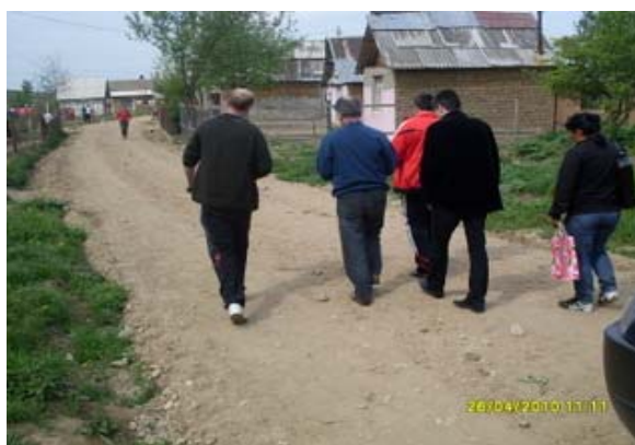
Reabilitarea drumului de acces in comunitatea Danko Pista, oras Sacuieni