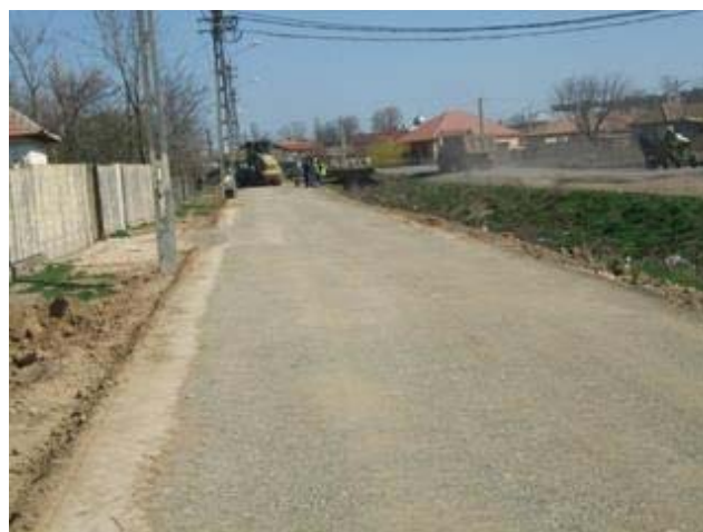
Drumul reabilitat in comunitatea de romi din comuna Mihail Kogalniceanu